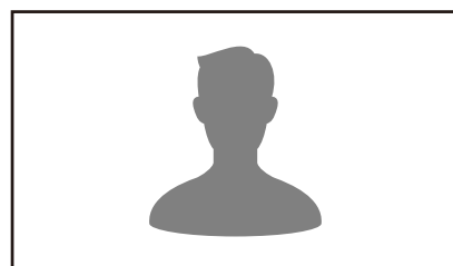
【有名人などの写真】